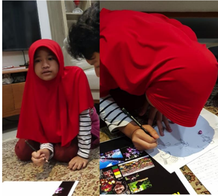
Gambar 1. Wawancara dengan subjek penelitian