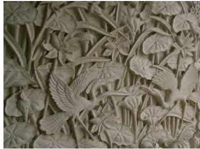
Gambar 1 relief batu padas.

Desain, kegiatan kreatif yang terkait dengan kreasi desain grafis, desain interior, desain produk, desain kerajinan. Desain sebagaimana yang dikemukakan Pangestu (2008: 132) bersifat multidimensional dan kompleks, dimana ide, gagasan tidak saja bersifat objektif namun juga bersifat subjektif yang disesuaikan dengan kepentingan dibuatnya suatu desain pada suatu produk. Desain sebagai hal yang penting di dalam pengembangan suatu produk diungkapkan Arsa dan Laba (2014), karena melalui desain yang kreatif dapat berimplikasi pada penjualan produk tersebut. Semakin menarik desain suatu produk yang dibuat, maka semakin berminat konsumen untuk membeli produk tersebut. Proses desain dalam penciptaan produk kerajinan dapat dilihat pada gambar di bawah.