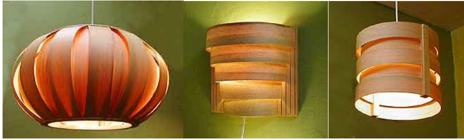
Gambar 2 Desain kap lampu bahan bamboo

Mode, kegiatan kreatif yang terkait dengan kreasi desain pakaian, desain alas kaki, aksesoris, produksi, distribusi dan lainnya. Subsektor industri kreatif di bidang mode sebagai gaya hidup memiliki definisi sangat luas, sehingga produk yang dapat dikembangkan menjadi sangat beragam dan kompleks. Namun bila dilihat dari pandangan yang lebih sempit yakni suatu kegiatan kreatif yang terkait dengan desain pakaian, desain alas kaki, desain aksesoris, dalam praktiknya terdapat kegiatan produksi mode dan aksesoris, serta distribusi produk mode. Industri mode dalam penerapannya di Indonesia telah memberikan manfaat ekonomi bagi banyak pihak, diantaranya asosiasi perancang, asosiasi sepatu, asosiasi penyamak kulit, peneliti bahan baku dan teknologi produksi. Industri mode saat ini berkembang sangat pesat seiring dengan kebutuhan stakeholder akan bentuk-bentuk baru kekinian yang diinformasikan dan di promosikan lewat media cetak maupun elektronik. Dampak ekonomi yang ditimbulkan dapat dirasakan oleh masyarakat menengah ke bawah yang menekuni pekerjaan sebagai tukang jarit. Bahkan di Bali setelah dikeluarkan kebijakan Gubernur dengan menetapkan setiap hari Kamis dan Purnama, Telem untuk berpakaian adat Bali banyaknya hari raya yang menuntut umatnya untuk menggunakan pakaian adat, telah berimplikasi terhadap perkembangan mode dan penjual kain kebaya maupun ( daster /udeng ).