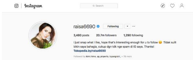
Gambar 6 Akun Raisa Andriana

Artis papan atas Indonesia, kini mulai merambah ke dunia maya. Kehidupannya yang menarik untuk disimak, mengundang jutaan warganet, mengikuti akun sosial media di dunia maya, khususnya Instagram. Salah satu akun Mega Influencer yang paling berpengaruh saat ini adalah raisa6690, akun yang dimiliki oleh Raisa Andriana, seorang penyanyi Indonesia.