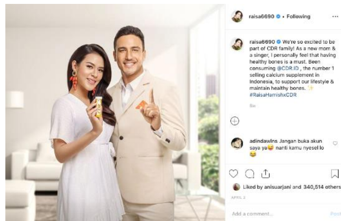
Gambar 8 Akun Raisa Andriana Mempromosikan CDR

Raisa yang baru saja menikah dan memiliki keluarga baru, juga berkolaborasi dengan produk kesehatan CDR. Citra Raisa sebagai penyanyi cantik, kini bertambah dengan citra perfect couple . Bersama dengan suaminya Hamish Daud, konten Raisa yang menyajikan dirinya dengan suami dalam mempromosikan produk kesehatan, mampu menarik 340.514 likers warganet yang melihatnya. Keserasian Raisa dengan suami, juga menjadi sebuah peluang influencer dalam mempromosikan produk-produk keluarga yang pastinya akan cenderung diminati oleh para penggemar setia Raisa.