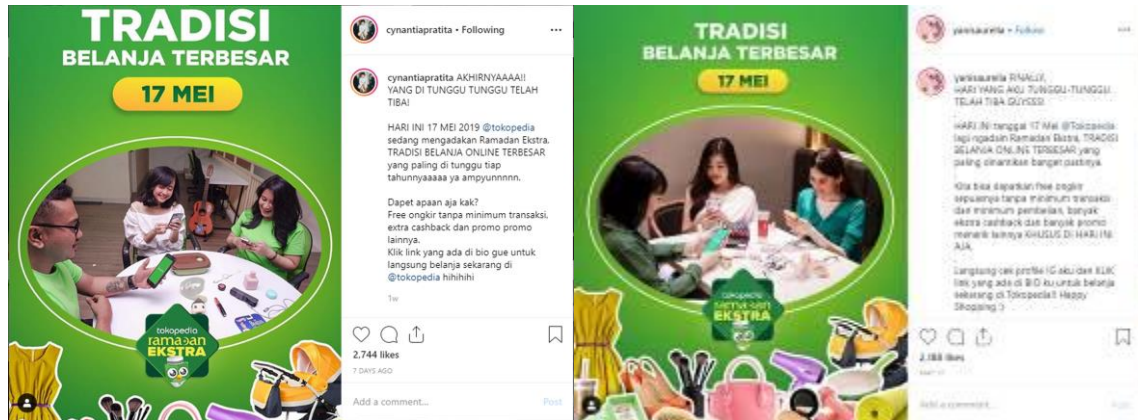
Gambar 3 Penggunaan Influencer dari Tokopedia