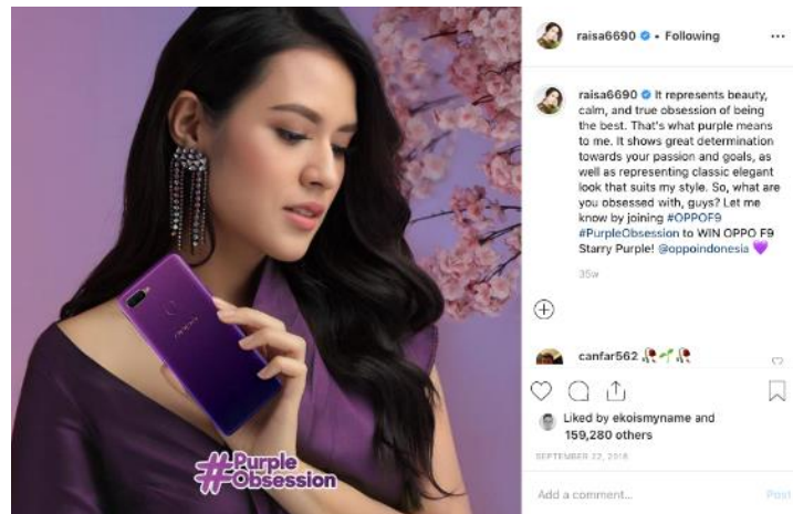
Gambar 7 Akun Raisa Andriana Mempromosikan Oppo (Dokumentasi: Instagram. 2019)

Raisa yang baru saja menikah dan memiliki keluarga baru, juga berkolaborasi dengan produk kesehatan CDR. Citra Raisa sebagai penyanyi cantik, kini bertambah dengan citra perfect couple . Bersama dengan suaminya Hamish Daud, konten Raisa yang menyajikan dirinya dengan suami dalam mempromosikan produk kesehatan, mampu menarik 340.514 likers warganet yang melihatnya. Keserasian Raisa dengan suami, juga menjadi sebuah peluang influencer dalam mempromosikan produk-produk keluarga yang pastinya akan cenderung diminati oleh para penggemar setia Raisa.