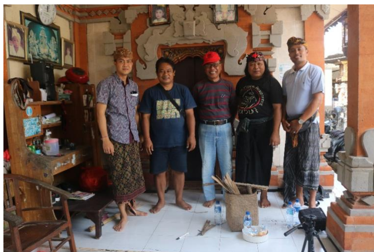
Gambar 1. Sosialisasi Kegiatan Pembinaan Gending Gambang Labdha Pada Sekaa Gambang Munggu

Tahapan sosialisasi awal dilakukan dengan mitra saat meminta kesediaan mitra untuk bekerjasama disertai surat persetujuan, selanjutnya mengadakan pertemuan dengan pihak Sekaa Gambang Munggu guna membahas rencana program. Langkah berikutnya berkoordinasi untuk keterlibatan jumlah peserta, kesiapan tempat pelatihan dan peralatan pelatihan.