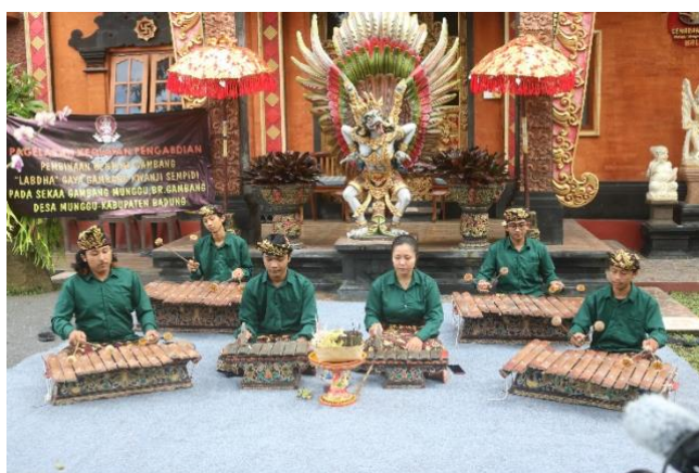
Gambar 2. Penyajian Hasil Pembinaan Gending Gambang Labdha Pada Sekaa Gambang Munggu

Pada tahap ini diadakan gladi atau uji coba penyajian hasil proses pelatihan gending Gambang Labdha yang dituangkan. Hasilnya, gending Gambang Labdha sebagai materi utama dalam proses pelatihan ini telah dikuasai dengan baik oleh Sekaa Gambang Munggu . Sekaa Gambang menampilkan dalam bentuk pertunjukan gending Labdha secara utuh mulai dari bagian pertama hingga akhir. Dalam tahap ini, tim mengundang dosen Karawitan dan seniman Gambang yang memiliki keahlian di bidang gamelan Gambang, pemuka adat, serta beberapa seniman Desa Munggu.