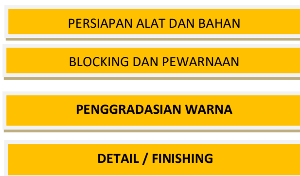
Bagan. 1 : Alur pembuatan karya seni lukis