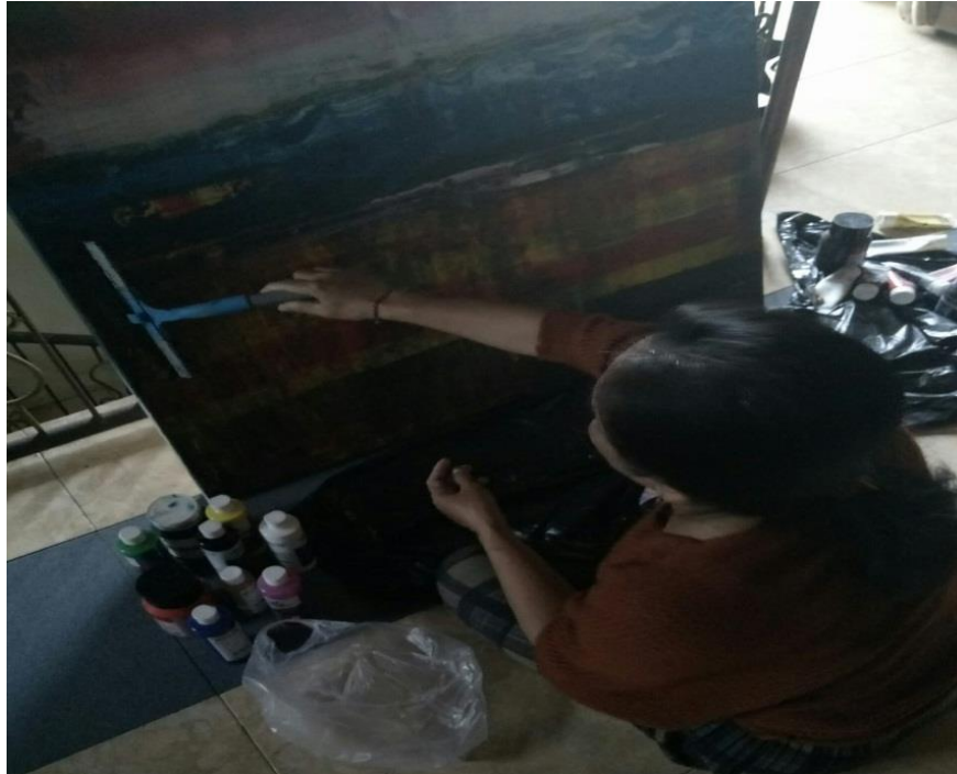
Gambar. 2 : Proses Berkarya