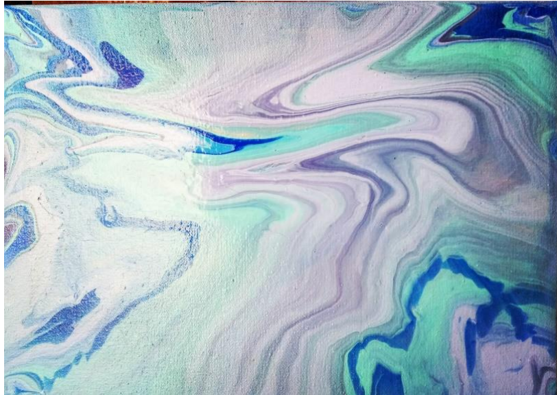
Gambar.3 : Karya. 1 Air Campuan