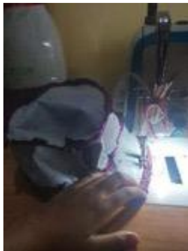
Gambar 6. Proses menjahit bagian-bagian busana