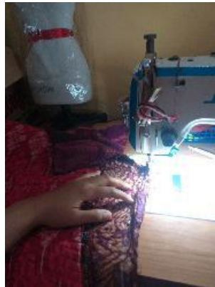
Gambar 5. Proses menjahit rekacipta tekstil [Sumber : Tim Peneliti, 2022]