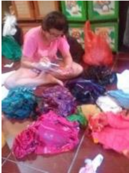
Gambar 2. Proses memilah perca

j. Mensetrika kain perca, lalu mulai memotong sesuai pola.