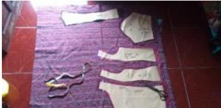
Gambar 4. Proses memotong perca dan bahan penunjang kain tenun seseh