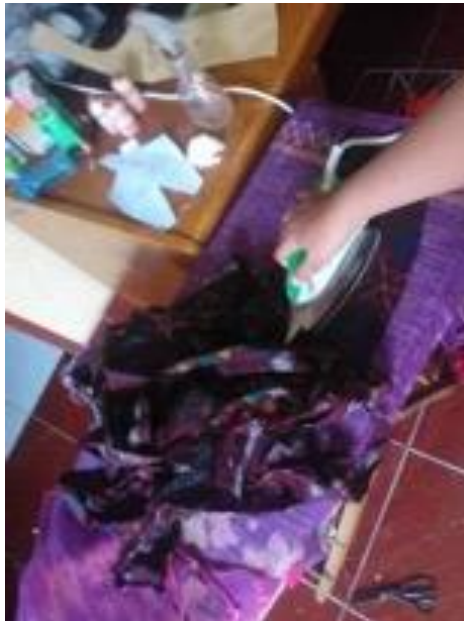
Gambar 3. Proses mensetrika perca

j. Mensetrika kain perca, lalu mulai memotong sesuai pola.