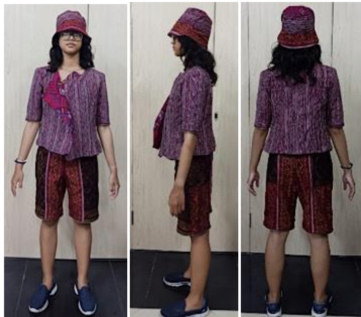
Gambar 9. Look style gaya busana 3, a. tampak depan, b. tampak belakang) [Sumber : Tim Peneliti, 2022]