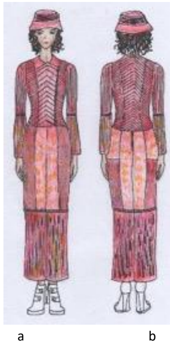
Gambar 1. Ilustrasi desain , a. tampak depan, b. tampak belakang)