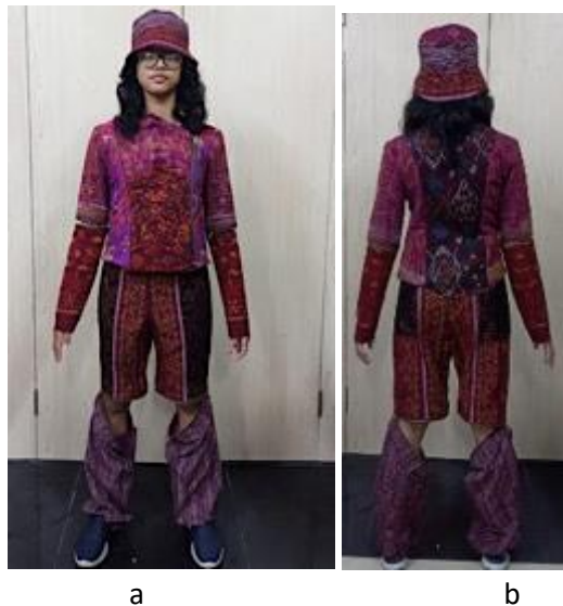
Gambar 8. Look style gaya busana 2, a. tampak depan, b. tampak belakang)