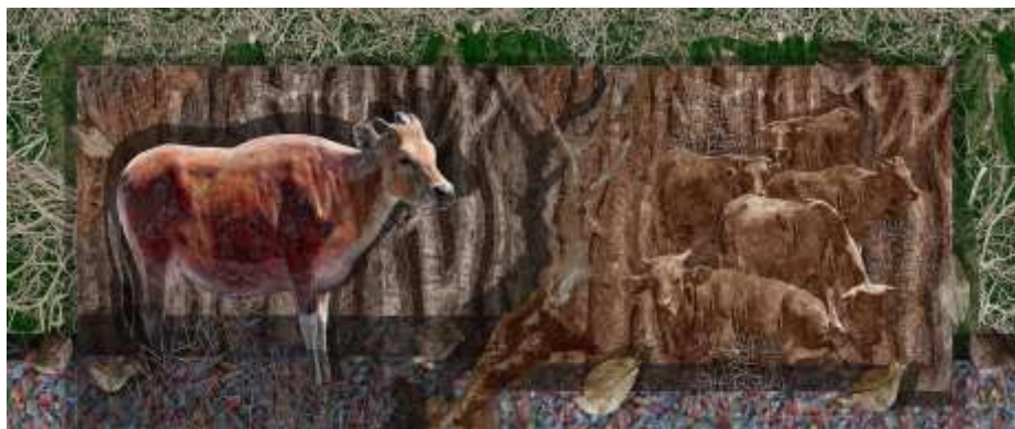
Gambar 5. Karya V, “Kelangkaan Rumput Hijau”

lingkungan hanya mementingkan kepentingan pribadi contohnya membuang sampah sembarangan, menggunakan bahan anorganik secara berlebihan. Dalam karya nampak kumpulan sampah anorganik seperti kaleng, botol plastik di lautan. Sampah plastik yang beragam diantaranya dihadirkan dengan komposisi tumpang tindih berserakan dalam air laut. Adanya air yang berwarna merah amenggambarkan bagaimana kondisi air yang terkontaminasi sampah anorganik yang bisa mengancam kehidupan ekosistem laut salahsatunya ikan. Sedangkan efek air dengan kilauan nampak tranparan memperkuat narasi kehidupan di bawaah air laut. Komposisi sepertiga bidang dipilih untuk menyesuaikan sisi atas dan bawah sehingga nampak dinamis. Kedalaman ruang atau perspektif otomatis bisa dimunculkan dari latar belakang itu sendiri sehingga secara keseluruhan tampilan karya terlihat lebih harmonis. Melalui karya ini pencipta ingin menyampaikan pesan bahwa laut merupakan unsur penting di alam semesta ini yang seharusnya selalu dijaga sehingga bisa bermanfaat bagi mahluk hidup khususnya manusia.