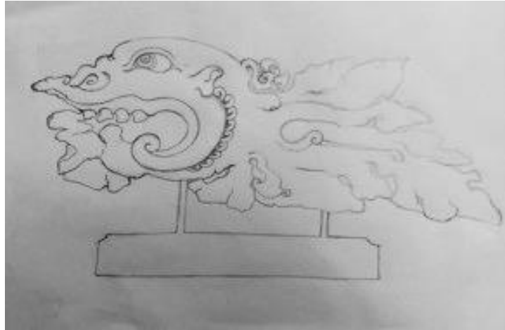
Gambar 3. Sketsa/rancangan karya stilistik binatang terpilih