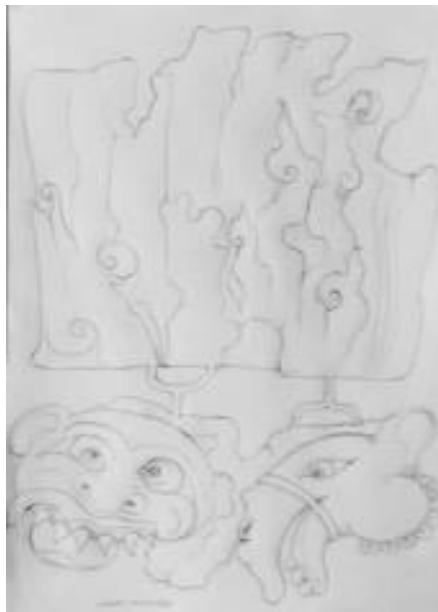
Gambar 2. Sketsa/rancangan karya stilistik binatang terpilih