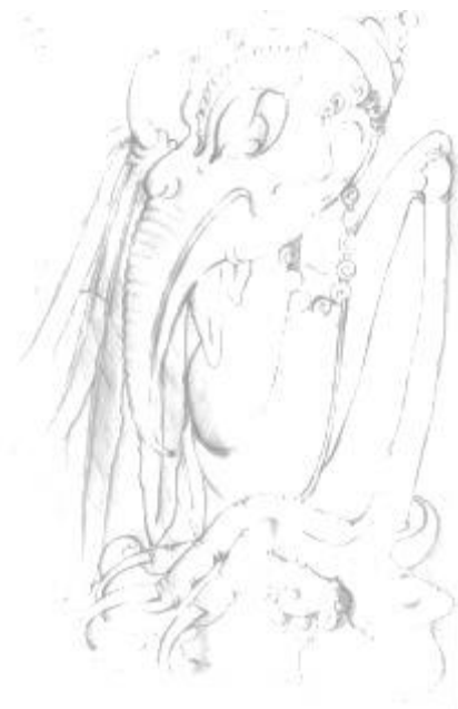
Gambar 4. Sketsa/rancangan karya stilistik binatang terpilih