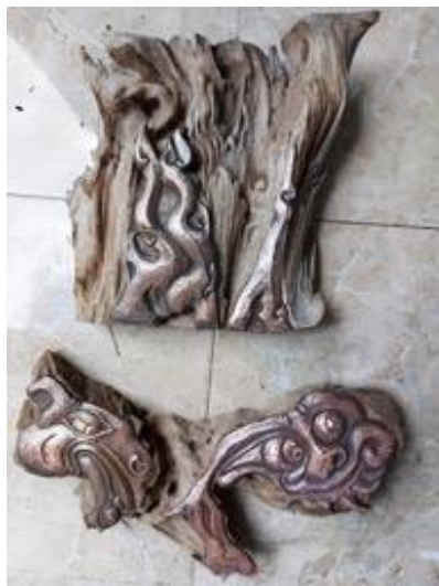
Gambar 9. Proses pembentukan ukiran tembaga karya Agni Murup

Proses pembentukan logam tembaga dilakukan tahap demi tahap, diawali dari pembakaran logam tembaga dengan menggunakan kompor, tujuannya agar logam menjadi elastis dan mudah dibentuk. Selanjutnya tahap berikutnya menempelkan desain yang sudah ada di atas plat logam tembaga dengan menggunakan lem, kemudian baru dipasang di atas jabung yang sudah disiapkan kemudian baru dimulai proses pemahatan dimulai dari pahat rancangan untuk membentuk goresan di atas logam sesuai desain yang ada, kemudian baru dilakukan pemahatan wudulan yang tujuannya untuk membuat cembung pada bagian-bagian permukaan logam sesuai disain. Tahap berikutnya baru dilakukan pembentukan detail secara bertahap sehingga bisa membentuk pahatan sesuai dengan yang telah ditentukan, detail dibuat sebaik mungkin sehingga memperlihatkan pahatan yang baik. Selanjutnya baru dibuat garis kontur yang tegas dengan menggunakan pahat logam, dan kemudian baru diberi tekstur pada bagian-bagian tertentu sesuai desain, jika hasil tatahannya sudah dianggap selesai, baru dilakukan pembakaran logam yang masih menempel tadi di atas jabung untuk bisa diangkat dan dibersihkan.