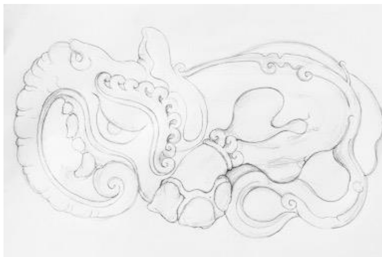
Gambar 5. Sketsa/rancangan karya stilistik binatang terpilih