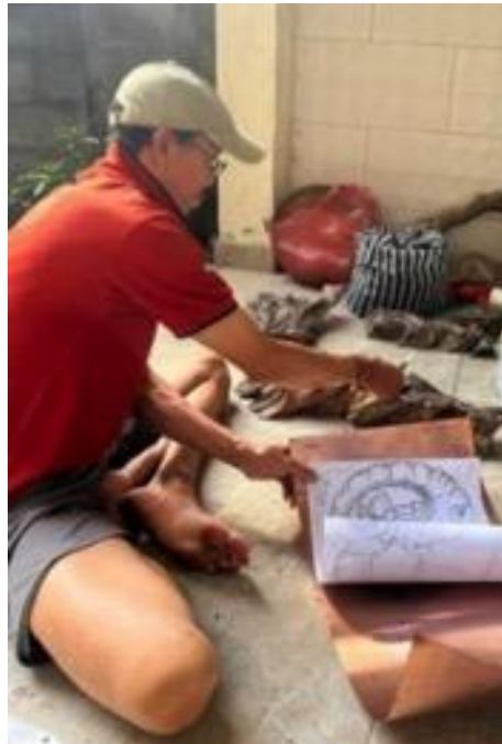
Gambar 7. Proses penempelan sket pada logam tembaga