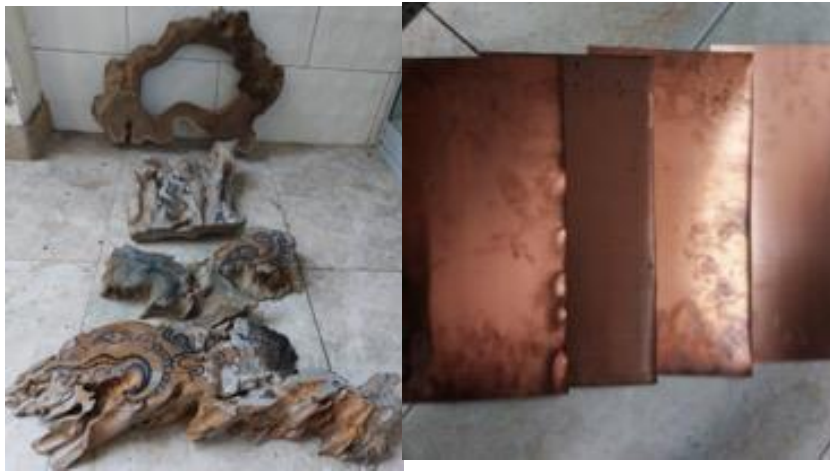
Gambar 6. Kayu jati dan plat tembaga

Kayu jati dan logam tembaga sebagai bahan dasar dalam penciptaan ini yang memiliki karakter masing-masing.