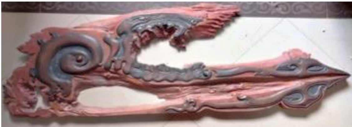
Gambar 11. Judul: Naga Penyelamat Bumi; Bahan: Kayu Jati, Tembaga dan Batu Permata; Ukuran : 140 cm x 50cm; Tahun: 2023

Zaman semakin berkembang, manusia menjadi semakin serakah, mengeksploitasi isi alam yang berujung kerusakan yang sangat merisaukan. Tanah tidak lagi mampu menumbuhkan tumbuh-tumbuhan dengan baik sebagai sumber makanan, air tidak lagi berkasiat, udara pun penuh polusi. Tanah, air dan udara tidak berfungsi sebagaimana mestinya, hidup manusia dan makhluk hidup lainnya menjadi sengsara.