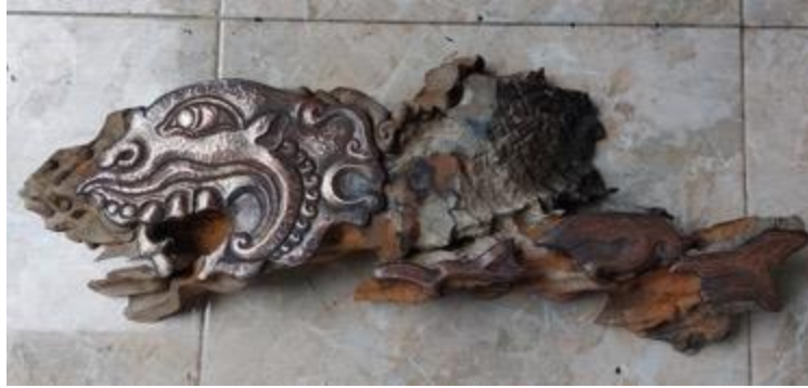
Gambar 10. Proses pembentukan ukiran kayu dan tembaga karya Ikan Mas