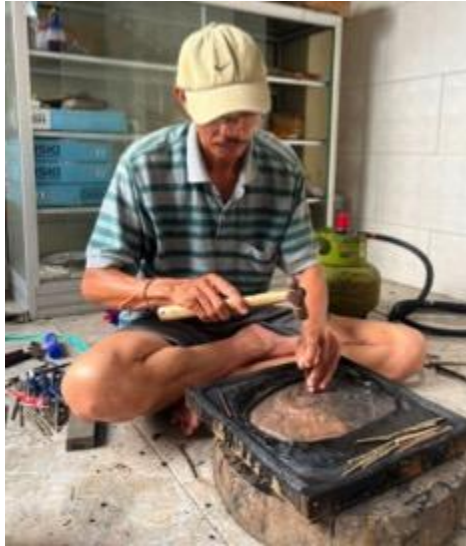
Gambar 8. Proses pembentukan logam tembaga