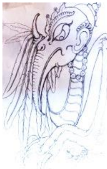
Gambar 15. Judul: Pedande Bake; Bahan: Kayu Jati dan logam Tembaga; Ukuran: 40 cm x 80 cm; Tahun: 2023