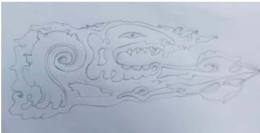
Gambar 1. Sketsa/rancangan karya stilistik Binatang terpilih

Adapun perwujudan sket-sket karya stilistik binatang dalam penciptan kriya kontemporer, sebagai berikut :