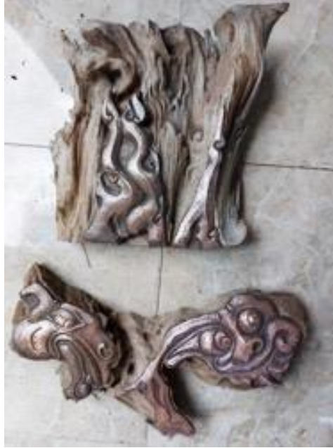
Gambar 12. Judul: Agni Murup; Bahan: Kayu Jati, Besi dan Logam Tembaga; Ukuran: 65cm x 55cm; Tahun: 2023

Ide penciptaan karya ini, masih berkuat pada kehidupan dan tradisi yang selama ini masih sangat melekat dan dipegang teguh dalam hidup sehari-hari. Hal ini sangat menginspirasi Agni murup. bahwa, api senantiasa dibutuhkan, dalam kehidupan mahluk hidup di dunia. Dalam tradisi dan budaya Bali, api tidak saja dibutuhkan untuk memasak, juga berkaitan dengan kehidupan dalam upacara agama (Hindu). Api yang bersinar dapat memberi penerangan, secara simbolis dapat digunakan sebagai saksi dalam upacara. Api dalam rumah tangga, sebagai sarana untuk memasak makanan, dalam hal ini, api diberi gelar " grhyapatya " [4].