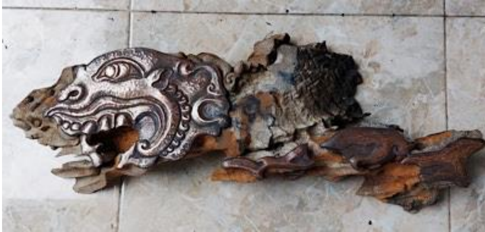
Gambar 13. Judul: Ikan Mas; Bahan: Kayu Jati dan Logam Tembaga; Ukuran: 70cm x 55cm; Tahun: 2023

Karya ini terinspirasi dari cerita kuno. Dalam mitos diceritakan, suatu waktu seorang raja bernama Satyavrata sedang melangsungkan upacara suci di tepi sungai. Waktu mengambil air dengan tangannya, secara tidak sengaja tertangkap seekor ikan. Ikan tersebut meminta dengan sangat agar ia tidak dikembalikan ke sungai lagi, karena ia akan dimakan oleh ikan yang lebih besar. Raja merasa kasihan kepada ikan itu dan dibawa ke istana ditempatkan dalam mangkok kecil. Keesokan hari ikan itu besarnya telah melebihi ukuran mangkok dan meminta kepada raja agar menempatkan dalam tempat yang lebih besar. Ikan ini dipindahkan dan ditempatkan dengan baik pada kolam, kemudian dipindah ke danau terjadi keajaiban, tempat tersebut tidak cukup, sehingga harus dipindah ke tempat yang lebih besar dalam wilayah kekuasaannya, itupun juga belum cukup, sehingga ikan yang menakjubkan ini harus ditempatkan di laut.