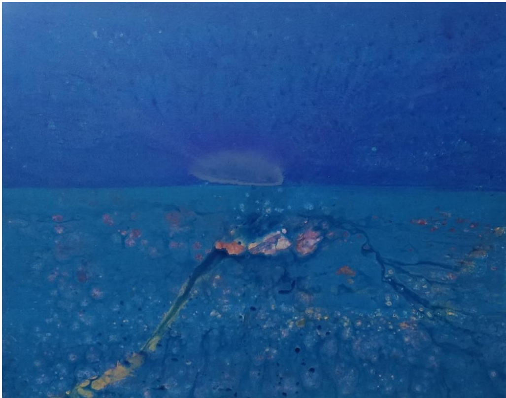
Foto. Karya I Wayan Karja, 2023, Samudera . Akrilik di atas kanvas 120 x 150 cm.