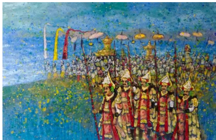
Gambar 3. Menuju Genah Melasti 140cm x 90cm, Mixed Media