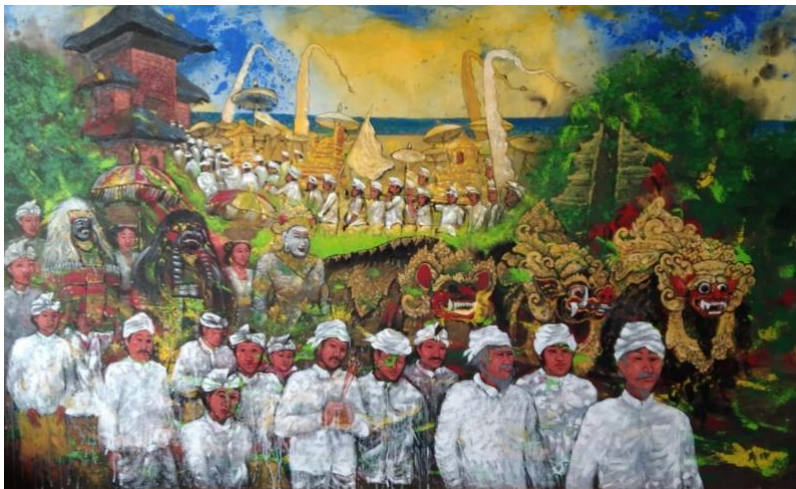
Gambar 7. Spirit Ngiring Melasti 200cm x 120cm, Mixed Media

Karya ini memvisualkan spirit melasti baik secara spiritual, fisik dan sekala, karya yang memvisualkan berbagai jenis objek seperti berbagai jenis barong, masyarakat dan pemangku .