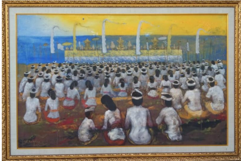
Gambar 5. Menjelang Sembahyang Saat Melasti 135cm x 85cm, Mixed Media

Tampilan sarana upacara, jempana , belum pencipta tampilkan dalam karya. Namun suasana khidmat masyarakat menjelang persembahyangan sudah pencipta tampilkan. Dalam suasana tersebut pencipta menampilkan ketertiban Masyarakat, rasa kebersamaan, tenggang rasa, memosisikan diri sebagai abdi dan bakti kehadirat Tuhan Yang Maha Esa.