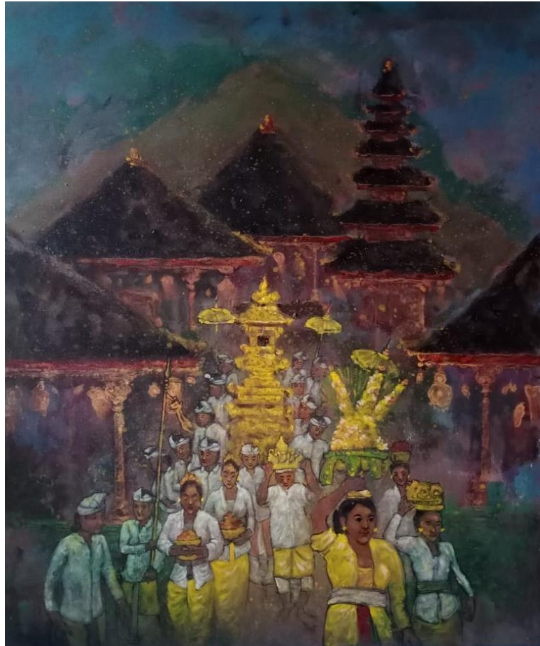
Gambar 1. Jagi Melasti 100cm x 120cm, Mixed Media

Karya yang berjudul " Jagi Melasti " ini mengungkapkan awal perjalanan masyarakat Hindu Bali menjelang dilaksanakannya upacara Melasti. Seluruh masyarakat, anggota keamanan, para orang suci dan juga pengurus maupun perangkat desa, sudah mempersiapkan diri mereka masing-masing sejak dini hari, untuk bisa bersiap dan hadir di pura. Mereka sudah mempersiapkan diri untuk dapat nedunang (mengeluarkan dan menurunkan) Pralingga Ida Sesusunan untuk dapat dilaksanakannya upacara Melasti. Pralingga tersebut akan ditempatkan di jempana dan disertai dengan sesajen/persembahan. Demikian juga sarana upacara lainnya yang menjadi kelengkapan melasti di usung oleh krama masyarakat.