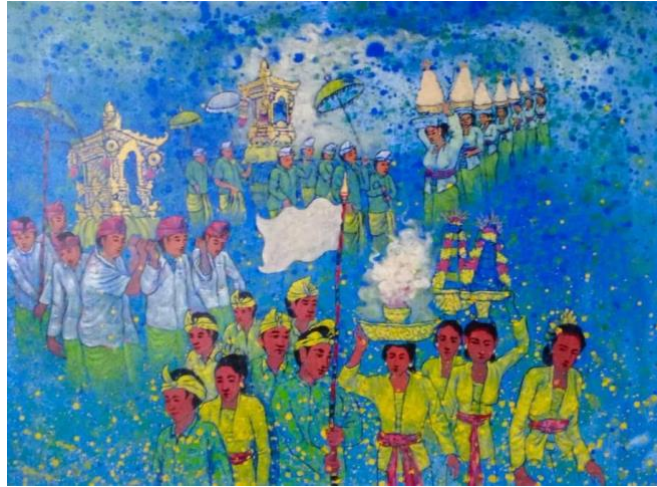
Gambar 2. Memargi Melasti 115cm x 90cm, Mixed Media

Karya ke dua ini pencipta terinspirasi dari iringan-iringan masyarakat yang turut serta dalam upacara Melasti. Adapun judul dari karya yang ke dua ini adalah “ Memargi Melasti ”. Memargi (Bahasa Bali halus) dalam Bahasa Indonesia adalah berjalan. Dalam perjalanan melasti menuju segara (laut) masyarakat beriring-iringan mengusung sesajen yang pada umumnya dikerjakan oleh para wanita. Sedangkan para pria mengusung jempana, kober, tedung, dan perlengkapan lainnya. Ada juga masyarakat mengikuti iring-iringan melasti menunggu giliran untuk dapat ngayah mengusung secara bergantian.