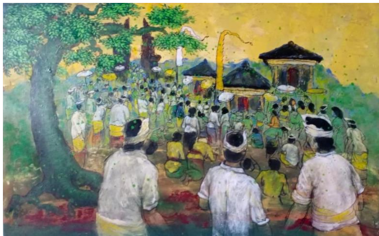
Gambar 6. Melinggih lan Katuran setelah Melasti 130cm x 85cm, Mixed Media [Sumber: Tim Pencipta 2023]