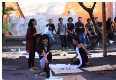
Gambar 1. Kegiatan Festival Nungkalik