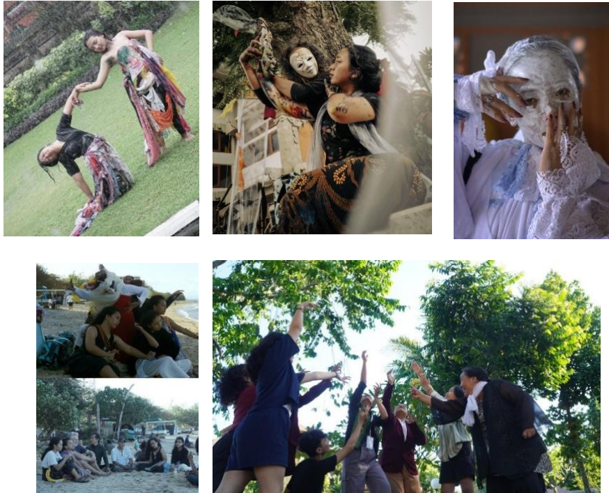
Gambar 2. Kegiatan Festival Nungkalik

langsung menyentuh dengan energi mereka masing-masing membuat kesan yang begitu pribadi masing-masing. Panitia berkesempatan untuk turut serta merayakan dalam rangkaian Sharing Discussion – Workshop – Art Performance.