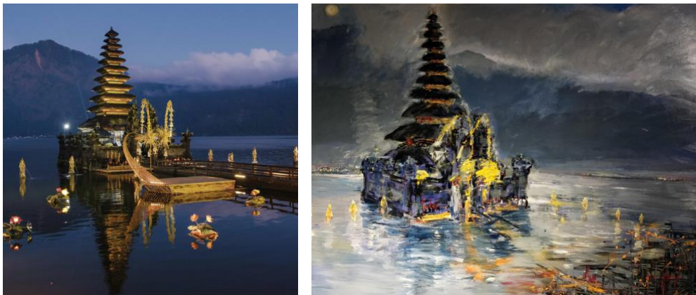
Gambar 6. Danau Batur adalah lokasi alami untuk seni visual dan pertunjukan. (Foto diarsipkan oleh Yayasan Puri Kauhan Ubud, Bali, 2022). Gambar 7. Karya I Wayan Karja sebagai respon melukis secara langsung di halaman Pura Segara Batur [Foto, I Wayan Karja, 2022]

Selain itu, seni lukis yang memuat konsep energi kosmis berpotensi menjadi media refleksi dan penyadaran akan keterhubungan manusia dengan lingkungan. Penggunaan simbol-simbol kosmis seperti sagara (laut) dan gunung dalam lukisan dapat memberikan makna yang mendalam, mencerminkan keseimbangan antara elemen-elemen yang berlawanan namun saling melengkapi dalam kosmologi alam. Sagara dan gunung, sebagai simbol kehidupan dan ketenangan yang kontras namun harmonis, mengajak penikmat seni untuk menjalani perjalanan spiritual yang melampaui batas fisik, menciptakan pengalaman kontemplatif yang memperkuat kesadaran akan keterhubungan manusia dengan siklus alam [21] [22] [11]. Dalam konteks ini, seni lukis kontemporer berperan sebagai jembatan antara dunia material dan spiritual, menghadirkan simbol-simbol alam sebagai sarana introspeksi dan refleksi diri bagi masyarakat modern yang semakin jauh dari nilai-nilai keseimbangan ekologis (Gambar 6 dan 7).