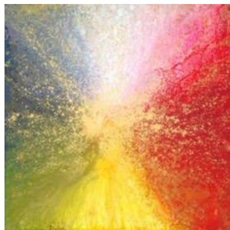
Gambar 5. Karya I Wayan Karja, 2024, Warna Pangider Bhuwana , Kosmologi Bali

Konsep energi kosmis memiliki makna mendalam dalam seni lukis kontemporer, karena ia menyoroti keterhubungan manusia dengan alam semesta yang lebih luas melalui bentuk dan warna/cahaya. Di tengah era modern yang terfokus pada kemajuan teknologi dan industrialisasi, konsep ini menjadi pengingat akan pentingnya harmoni dengan kekuatan alam dan dimensi spiritual, konsep 'green' diinisiasi untuk mengatasi hubungan manusia dan alam semesta. Seni lukis yang mengangkat tema energi kosmis mengajak penikmat seni untuk merasakan kembali kehadiran elemen-elemen alam seperti matahari, bulan, bintang, serta siklus alami lainnya, yang secara simbolis mencerminkan perjalanan batin manusia. Melalui karya seni ini, seniman dapat menyampaikan pesan tentang keseimbangan antara fisik dan spiritual, mengajak masyarakat untuk merenungkan nilai-nilai transendensi di tengah kehidupan sehari-hari.