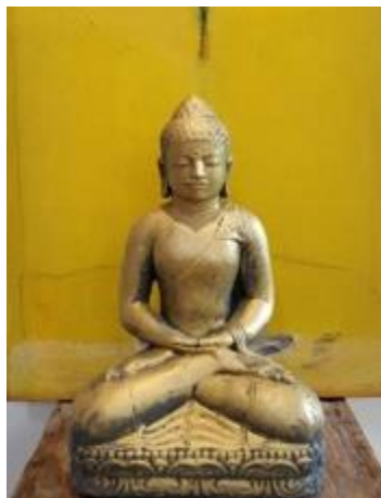
Gambar 8. I Wayan Karja, 2020. Menuju keheningan kombinasi patung Buddha berwarna emas dengan kuning sebagai latar belakang