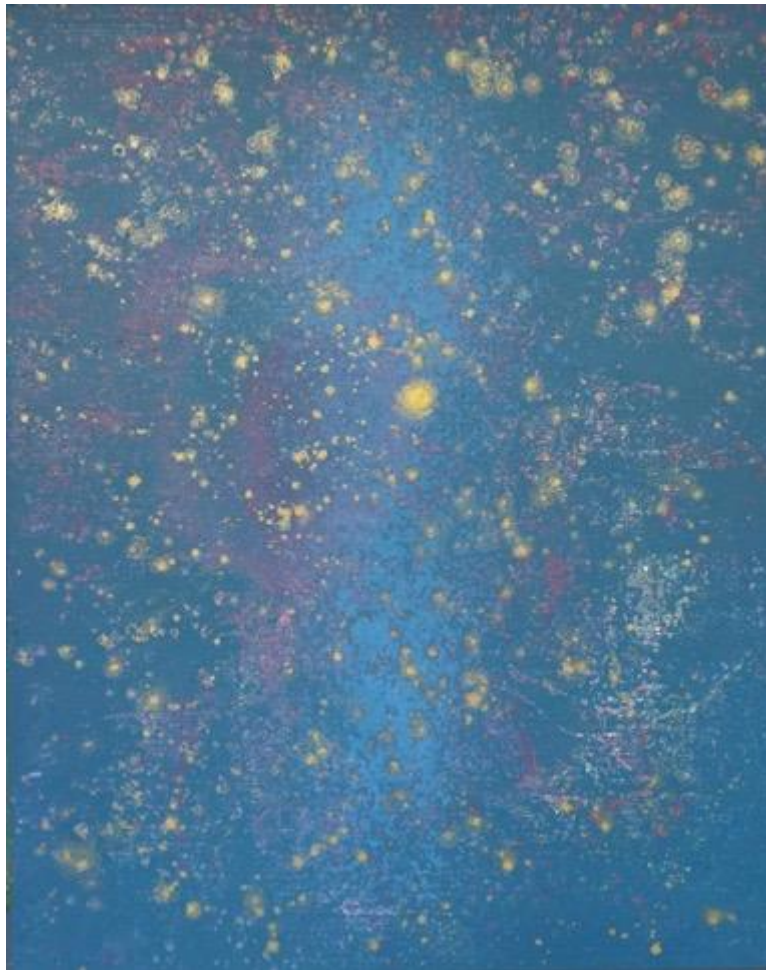
Gambar 11. I Wayan Karja, 2024. Energi Kosmik Biru [Foto: I Wayan Karja, 2024]

Karya Energi Kosmik Hitam dan Emas (2021) sebagai interpretasi visual tentang kekuatan kosmik yang menyatukan dualitas kegelapan dan cahaya dalam semesta. Lukisan ini mengeksplorasi hubungan simbolis antara kegelapan malam dan warna emas, menggambarkan galaksi yang berpendar di tengah kehampaan kosmik. Di sini, warna hitam bukan sekadar latar; tetapi melambangkan misteri alam semesta yang tidak terukur, sedangkan warna emas mencerminkan kemuliaan dan cahaya yang menembus kegelapan, menyiratkan adanya energi transformatif. Terinspirasi oleh pengalaman subjektif dan kontemplasi estetik mendalam, menyajikan karya ini sebagai refleksi meditasi yang mendorong audiens merenungkan konsep ketidakterhinggaan dan keterhubungan manusia dengan semesta. Lukisan ini tidak hanya menawarkan estetika visual, tetapi juga membuka ruang introspektif bagi penikmat, untuk membayangkan kemahaluasan kosmos secara simbolis-imajinatif. Karya ini menjadi wadah pengalaman kosmik, di mana warna dan bentuk berpadu untuk mengungkap makna mendalam dari keberadaan manusia di tengah jagat raya yang tidak terbatas, mengajak setiap penikmat menyelami hakikat diri dan menemukan kesejatan yang menyatu dengan alam semesta (Gambar 12).