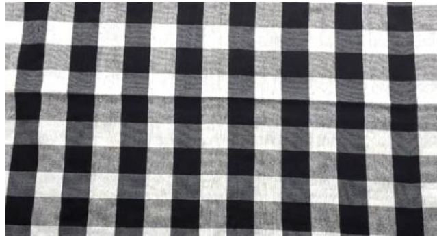
Gambar 2. (Kiri) Yin Yang sebagai simbol kosmis dalam budaya Cina. Gambar 3. (Kanan) Kain Poleng, hitam putih dan abu sebagai simbol kekuatan yang berlawanan dalam ajaran dualitas Bali ( rwabhineda )

Konsep energi kosmik dihadirkan melalui pola simetris dan komposisi warna yang menciptakan harmoni, mencerminkan keseimbangan alam semesta dalam bentuk visual yang menghormati kekuatan ini. Selain kekuatan dualitas falsafah keseimbangan di Bali terdapat dalam multidimensi, salah satu yang sangat populer adalah Tri Hita Karana (Pitana, 2010). Pada Gambar 4 dan 5, konsep warna kardinal meliputi empat warna utama: putih (Timur), merah (Selatan), kuning (Barat), hitam (Utara), dan empat warna sekunder: pink, oranye, hijau, dan abu-abu/biru di arah lainnya. Setiap arah ini didampingi Dewa tertentu, seperti Iswara di Timur dan Siwa di pusat, serta mencerminkan energi alam. Mandala yang terbentuk menggambarkan kesatuan kosmos yang penuh energi dan keseimbangan semesta [19] [20] [6].