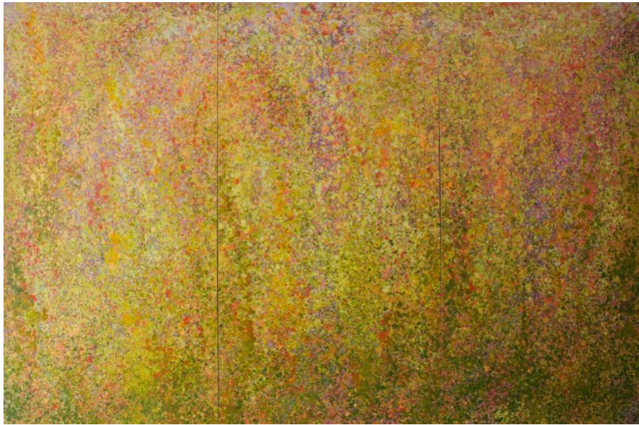
Gambar 9. I Wayan Karja, 2024. Meadow Grass , rumput-rumput liar yang berwarna-warni ketika musim semi

Selain menggunakan imaji visual yang memanfaatkan simbol-simbol dari ajaran agama Hindu dan Buddha, penulis juga menggunakan alam sebagai inspirasi untuk menciptakan karya seni yang bertujuan mencapai keseimbangan lahir batin dan harmoni diri. Baas dan Jacob (2004) menekankan bahwa seni kontemporer yang terinspirasi oleh pemikiran Buddha membuka ruang bagi seniman untuk mengalami keheningan dan kedalaman batin [25]. Salah satu pendekatan menuju keheningan ini adalah dengan mengamati dan menciptakan karya yang terinspirasi dari alam yang terbuka, tenang, damai, dan penuh warna indah (Gambar 9). Sebagai salah satu contoh, pengalaman penulis mengamati rumput-rumput liar ketika musim semi di Swiss menjadi catatan penting dalam memperkuat hubungan diri dengan alam semesta. Jarak yang jauh dari kampung halaman memberikan perspektif lebih luas untuk mengeksplorasi diri dan semesta, semuanya untuk mencapai harmoni yang mendalam.