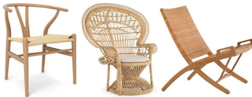
Gambar 1. Kursi karya Hans J. Wegner. Dari kiri ke kanan: Wishbone Chair (1949), Peacock Chair (1947), Folding Chair (1949).

(Sumber: www.smow.com , www.1stdibs.com , dan www.amazon.com , 2020)