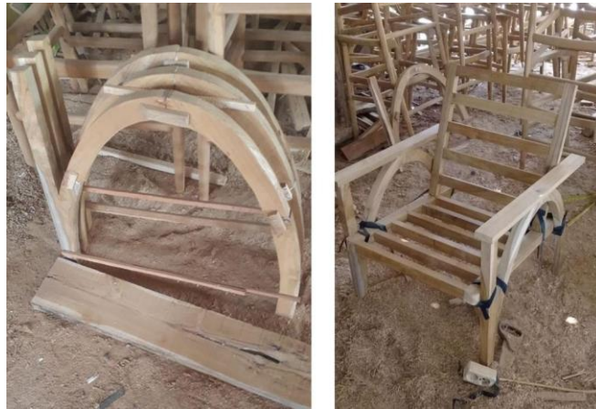
Gambar 4. Kompilasi Foto Pengerjaan Kursi

Setelah merealisasikan kursi yang telah di desain ( Gambar 3 & Gambar 4 ), untuk mengembangkan dan memperbaiki desain kursi, diberikan umpan balik dari beberapa ahli di bidang mebel atau furniture . Diantaranya, dosen dan tim pengajar, penjual mebel, tukang, dll. Berdasarkan masukan yang diberikan, diketahui bahwa desain kursi cukup menarik perhatian pengguna, ditambah dengan dudukan kursi yang nyaman dan luas. Kekurangannya yaitu harga produksi kursi yang cukup mahal, serta perlu ditambah variasi warna atau tema untuk menunjang kebutuhan pasar. Kursi ini dapat mendukung perekonomian lokal dengan mengandalkan sumber daya lokal baik tenaga kerja seperti tukang atau pengrajin dan sumber daya material yaitu kayu lokal.