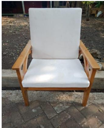
Gambar 5. Hasil Akhir Kursi

Dalam proses pembuatan kursi becak, banyak pihak yang terlibat mulai dari dosen, mahasiswa, hingga tukang dan supplier material. Melalui desain kursi becak, diharapkan mampu mendongkrak perekonomian lokal, sebab mulai dari proses ideasi hingga realisasi kursi becak, semuanya tidak lepas dari sumber daya Indonesia sendiri. Bahan kayu jati sengaja dipilih karena memiliki karakteristik kayu yang kuat dan tahan lama, dan juga mudah ditemukan di Indonesia. Dalam hal ini, proses pembuatan kursi dilakukan di Jepara, yang terkenal akan kayu Jati dan masyarakat yang memiliki keahlian dalam mengolah kayu tersebut. Dengan ini, jika kursi becak banyak diminati oleh masyarakat, maka bukan tidak mungkin perekonomian lokal mampu ikut naik, mulai dari tukang, supplier material, hingga kurir pengiriman.